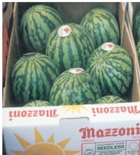
Слика 5. Мали округли лубеници спакувани за извоз во ЕУ.