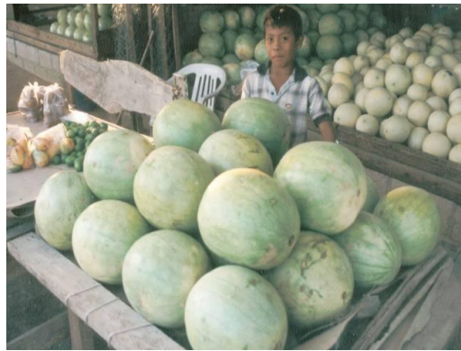
Слика 6. Лубениците треба да се продаваат набрзо по бербата за да се избегне загубата на квалитет при високи температури.

Оптималната температура за чување и транспорт на лубеница е 10°C. На оваа температура од 10°C рокот на траење на лубеницата на пазар изнесува 21 ден. Со зголемување на температурата за чување се намалува рокот на траење на лубеницата на пазар и плодовите губат од својата блажина. На 15°C рокот на траење на лубеницата на пазар обично изнесува 14 дена. Лубеници што се чуваат на амбиентална температура од околу 29°C треба брзо да се продадат, бидејќи нивниот квалитет брзо опаѓа. Лубениците што биле чувани на амбиентална температура повеќе од 2 недели нема да имаат добар вкус и ќе се изгуби крцкавоста на текстурата или ќе подлегнат на гнилеж.