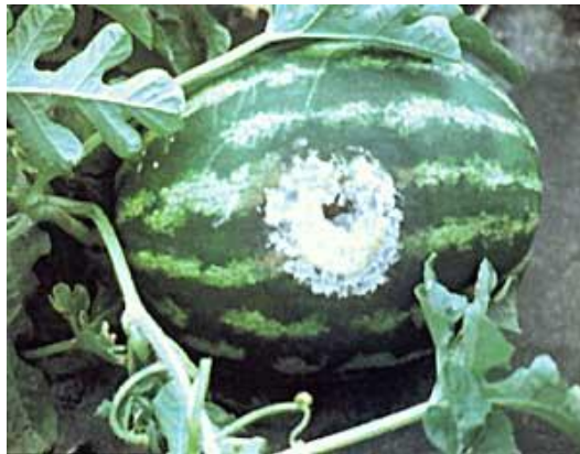
Слика 8. Сива точка и белкава мувла на плод инфициран со Фитофтора.

Гниењето Фитофтора го предизвикува габата Phytophthora capsici која што се пренесува преку земјата. Гниењето на плодот се појавува како масни флеку на надворешноста на кората. Веројатно е присуството на белкаста мувла врз масното ткиво (Слика 8). Најголема е веројатноста дека оваа болест ќе се јави за време или после периоди на силни дождови кога водата се задржува на нивата. Фитофтората може да се контролира со избегнување на садење во ниски области. Исто така, одредена заштита против оваа болест може да даде и фолијарното прскање со системскиот фунгицид металаксил.