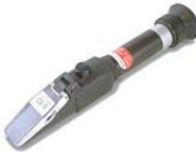
Слика 1. Рефрактометар за рачно мерење за одредување на содржината на растворливи тврди материи кај лубеница.

Можат да се користат неколку деструктивни показатели на случајно избрани плодови за да се процени зрелоста за берба на останати од род во нивата со приближно иста големина. Кога лубеницата ќе се исече на половина по должина, целото месо треба да биде добро обоено со еднаква црвена боја (освен ако не се работи за сорта на лубеница со жолто месо). Месото на незрелите лубеници е розево, а на зрелите лубеници црвено до темно црвено, додека презреаните лубеници имаат црвенкасто-портокалово месо. Кај семенските сорти, зрелоста е постигната кога желатинската обвивка околу семето веќе не е очигледна, а лушпата на семето е тврда и има црна или кафена боја. Лубеница која има многу бели семки не е зрела. Содржината на растворливи тврди материи во сокот е уште еден често користен показател за зрелост за берба. Растворливите тврди материи кај лубеницата најчесто се шеќери. Содржина на растворливи тврди материи во центарот на плодот од најмалку 10% е показател за зрелост. Содржината на растворливи материи се утврдува со цедење на неколку капки од сокот врз рефрактометар за рачно мерење (Слика 1). Исто така, месото на зрелиот плод треба да биде цврсто и крцкаво, а срцевината да не е шуплива.