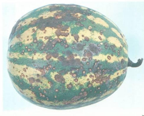
Слика 7. Гнилеж Антракноза кај лубеница.

Антракнозата ја предизвикува габата Colletotrichum orbiculare и претставува честа болест по бербата на лубеницата. Во време на бербата може да постојат неактивни инфекции без надворешни показатели за болеста. За време на чувањето, латентните инфекции можат да се активираат на високи температури или по изложување на услови на разладување кои можат да предизвикаат повреда. Болеста брзо се развива на температури меѓу 20 и 30°C. Габите можат да навлезат преку површината на плодот така што за инфекција не е неопходно постоење на ранички. Симптомите на антракнозата опфаќаат потонати точки на кората, кои на крај стануваат црни (Слика 7). На местата на гниење може да се појават црвени или портокалови спори.