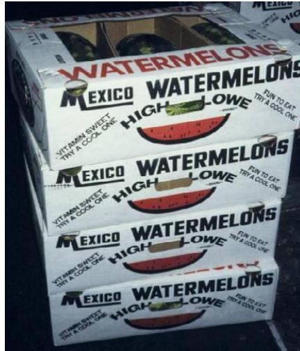
Слика 4. Три големи издолжени лубеници спакувани во картонски кутии наменети за пазар во ЕУ.

обучени за класирање и пакување. Лубениците што се пакуваат за извоз треба да се стават во цврсти кутии од ребрест картон со двојни ѕидови во кои собира три до пет лубеници, зависно од големината и формата на плодовите (Слика 4). Типичната тежина на оваа картонска амбалажа изнесува 25 до 35 кг. Бидејќи лубениците се многу тешки, во картонската амбалажа како потпора треба да се користат влошки. 6 до 8 помали топчести плодови можат да се пакуваат во една картонска кутија (Слика 5). Картонската амбалажа треба правилно да се реди една врз друга за да се овозможи соодветен проток на воздух низ товарот во текот на транспортот.