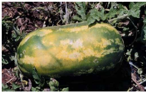
Слика 2. Сончев прегор кај незаштитен плод на лубеница.

Собраните лубеници треба да се отстранат од нивата колку што е можно побрзо. Изложувањето на директна сончева светлина попладне кога е најтопло може, само за неколку часа, да резултира во сончев прегор на површината на плодот. Штетата е поочигледна кај сортите со темна кора (Слика 2). Појавата на сончев прегор може да се намали со аплицирање на средство за заштита од сонце една недела пред бербата. Средствата што се користат за заштита од сонце опфаќаат полутечна смеса од калциум карбонат (вар) или раствор од глинен прашак. За време на бербата и ракувањето ворта или глинениот прашак можат да се избришат или измијат од плодовите. Ова не претставува маркетиншки проблем освен кога се користи површински активна супстанца при што прашакот се лепи за површината на плодот. Можно е купувачите да приговараат доколку на кората има остатоци или флеку.