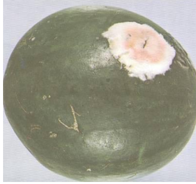
Слика 9. Гниење предизвикано од Фусаријум кај лубеница од сортата Шугарбејби.

Ризикот од појава на Фусаријум може да се намали на минимум со користење на отпорни сорти. Можноста од појава на оваа болест исто така се намалува со ротирање на местото на садење како и со отстранување и уништување на сите остатоци од растенијата. За да се избегне зараза со габата Фусаријум кај лубеницата се препорачува ротација на местото на садење на најмалку осум години. Оваа болест може да се рашири и со садење на претходно сочувано семе што дошло од заболен плод.