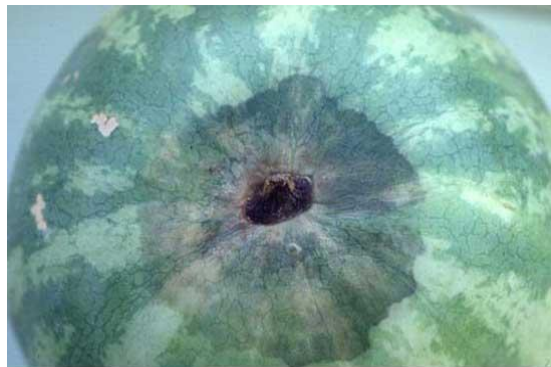
Слика 10. Симптоми на гниење на крајот од дршката.

Гнилежот на крајот од дршката го предизвикува габата Lasiodiplodia theobromae . Болеста прво се појавува како венење и сушење на дршката по што следи покафенување на зоната околу дршката, кое прогрсивно се зголемува со развојот на болеста (Слика 10). Отсеченото месо е забележително меко и со слаба кафена боја. Ако исечената лубеница е изложена на воздух неколку часа, заболените места стануваат црни. Болеста брзо се развива во плодот на температура од 25°C или повисока, додека на температура од 10°C се развива бавно или воопшто не се развива. За да се намали појавата на оваа болест, при бербата на секој плод треба да се остави дршка со должина од најмалку 2.5 см.