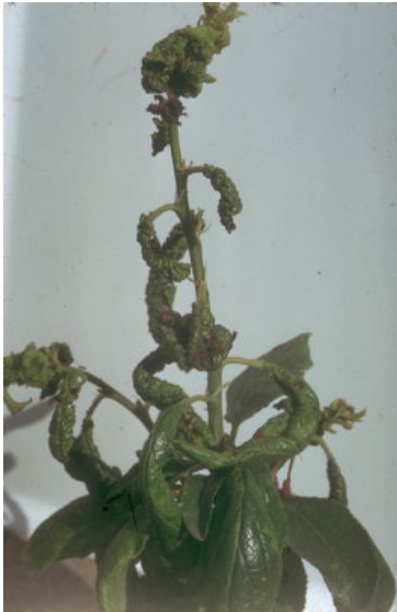
Слимова штитеста вошка ( Brachycaudus helichrysi )