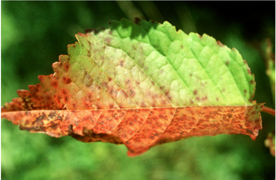
Пепелница ( Polistigma rubrum )