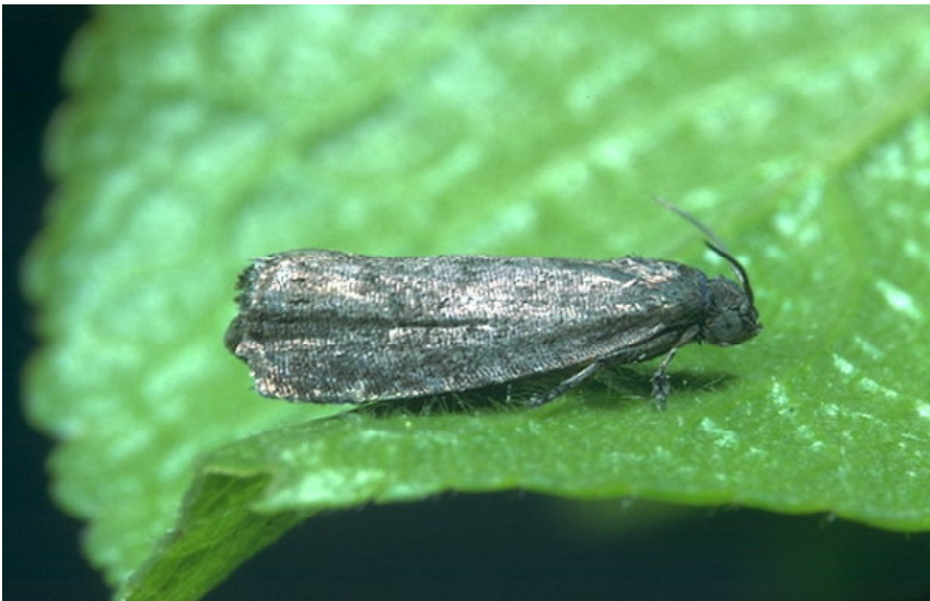
Сливов црв ( Cydia funebrana-imago )